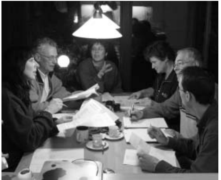
Bestuurs- en redactievergadering 2005

HINT Limburg begon als een piepkleine vereniging van bevriende ouders met dezelfde belangen: erkenning voor de problemen van hun hoogbegaafde kinderen. Die doelstelling is niet veranderd, maar de vereniging des te meer! De kleine club van weleer is uitgegroeid tot een vereniging van formaat, waar scholen en instanties niet meer omheen kunnen. Inmiddels vertegenwoordigt onze vereniging de belangen van ruim 250 gezinnen in heel Limburg. HINT staat in deze provincie voor professionaliteit en deskundigheid. Met een Zorgteam dat bestaat uit ervaringsdeskundigen met een grote kennis van de problematiek rond hoogbegaafdheid, bekleedt onze vereniging zonder meer een unieke positie ten opzichte van andere belangenverenigingen.